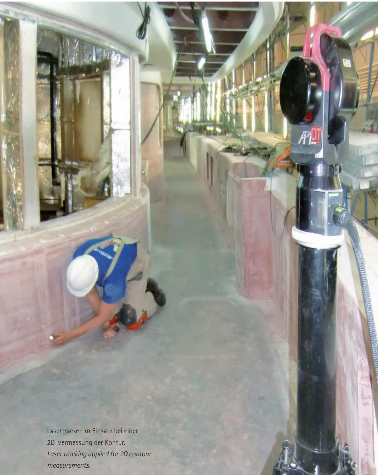
Lasertracker im Einsatz bei einer 2D-Vermessung der Kontur. Laser tracking applied for 2D contour measurements.