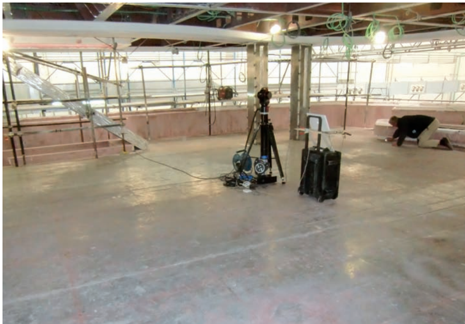
Ist-Aufnahme der Stahlsituation an Bord einer Mega-Yacht. Recording of the current steel situation on board of a mega-yacht.