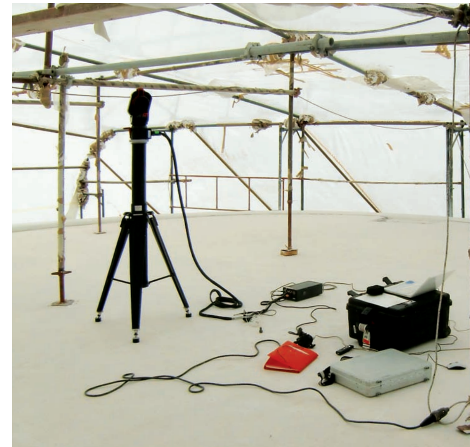
Kontrollmessung des bereits fertigen Leveling-Aufbaus für das anschließende Verkleben des Decks. Control measurement of the already finished leveling construction for later adhesion of the deck.