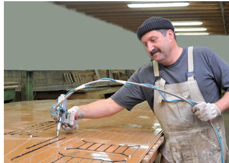
Verfugung der CNC gefrästen WOLZYNTEEK -Paneele. Joining of CNC-milled WOLZYNTEEK panels.

Sollte es über die Nutzungsdauer des WOLZYNTEEK -Decks zu eventuellen Schäden kommen, sind diese sehr einfach unter Berücksichtigung unserer mitgelieferten Reparaturanleitung zu beheben. Für Fragen steht Ihnen das Wolz Nautic Team selbstverständlich zur Verfügung.