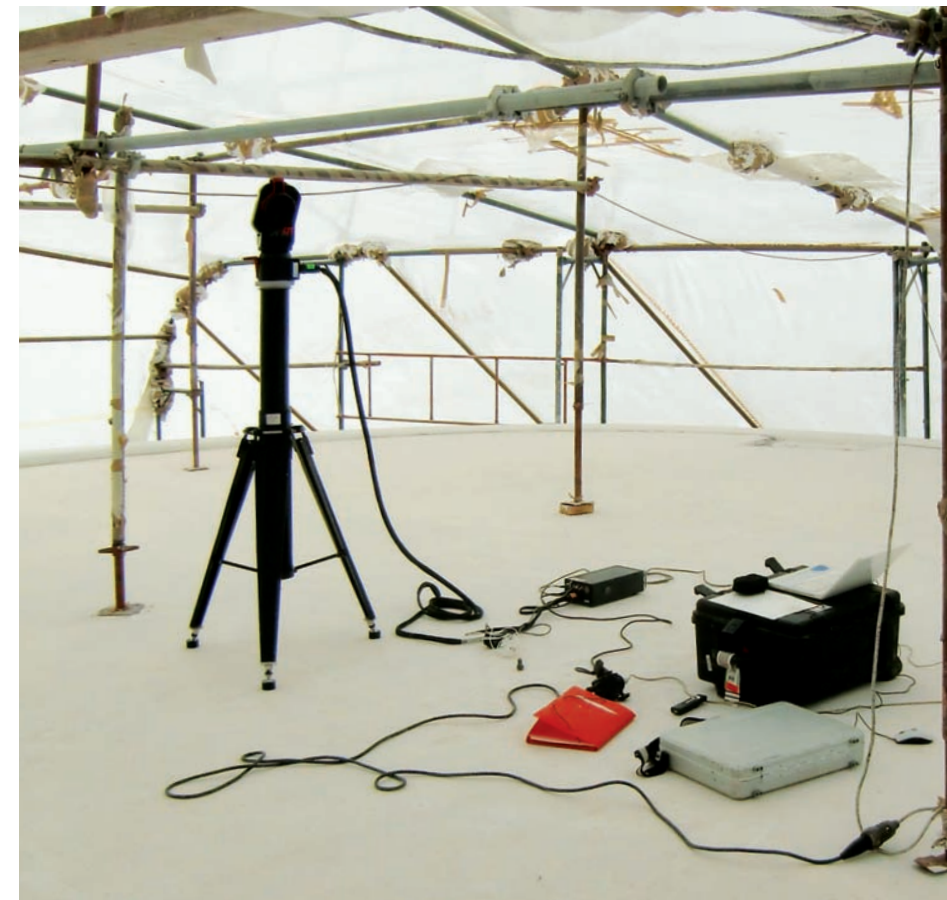
Kontrollmessung des bereits fertigen Leveling-Aufbaus für das anschließende Verkleben des Decks. Control measurement of the already finished leveling construction for later adhesion of the deck.