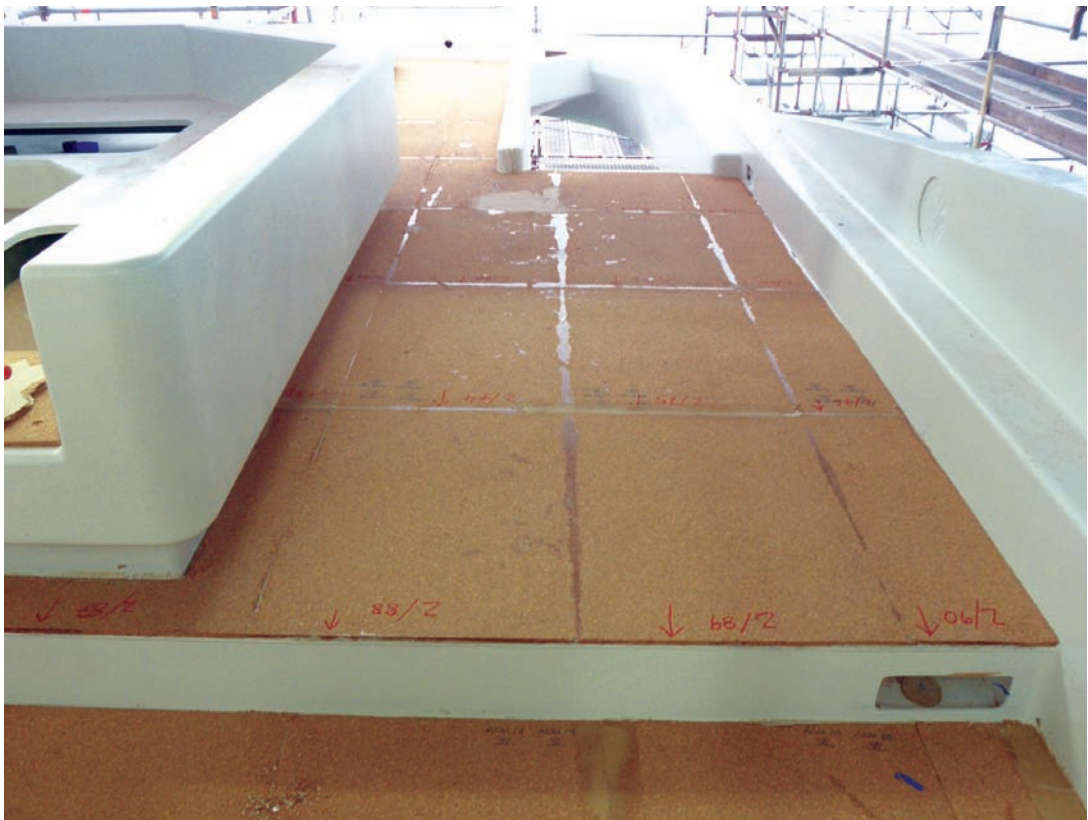
Fertig verklebtes Kork-Leveling durch das Vakuum-Verklebesystem auf einer 75m MY. Finally adhered cork leveling with vacuum-adhesive-technology on a 75 m mega-yacht.

Wolz Nautic Klinge 5 | D-97253 Gaukönigshofen Phone: +49 9337 9809-0 Fax: +49 9337 9809-10 info@wolznautic.de www.wolznautic.de